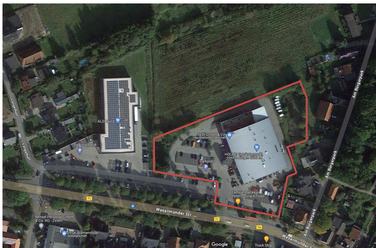
Abb. 1: Luftbildausschnitt mit Umrandung des Geltungsbereichs der 3. Änderung des Bebauungsplanes Nr. 96 (ohne Maßstab); Quelle: Google Maps

Das Vorhabengebiet liegt innerhalb der bebauten Ortslage von Bremervörde und ist mit einem großen Freizeitzentrum und dazugehörigen Stellplätzen bebaut und versiegelt. Das Grundstück ist im Westen und Nordwesten durch Baum-Strauchhecken und eine kleine Grünfläche eingegrünt, östlich grenzt ein Regenwasserrückhaltebecken mit einigen Bäumen und Hecken an. Im Bereich der Stellplätze wurden einige Einzelbäume angepflanzt. Östlich, südlich und westlich sind weitere Bebauungen vorhanden, nördlich erstrecken sich landwirtschaftliche Nutzflächen. Südlich des Freizeitentrums verläuft die „Wesermünder Straße“ (B 71/74) mit einem hohen Verkehrsaufkommen. Das gesamte Grundstück ist durch bauliche Nutzungen und Belastungen aus dem Verkehr deutlich überprägt und bis auf die Gehölzbestände für Natur und Landschaft von geringer Bedeutung.