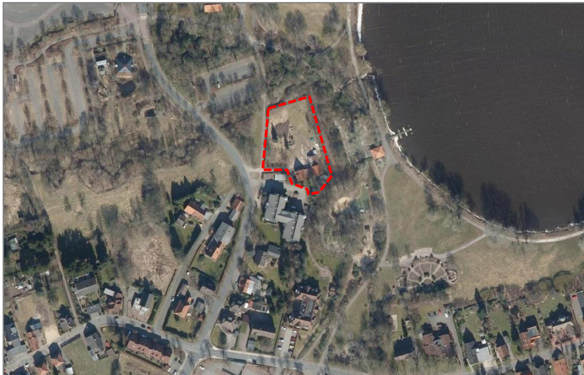
Abbildung 2: Luftbild mit Plangebietsabgrenzung (o. M.) © LGLN, Bearbeitung (Rot) eigene Darstellung