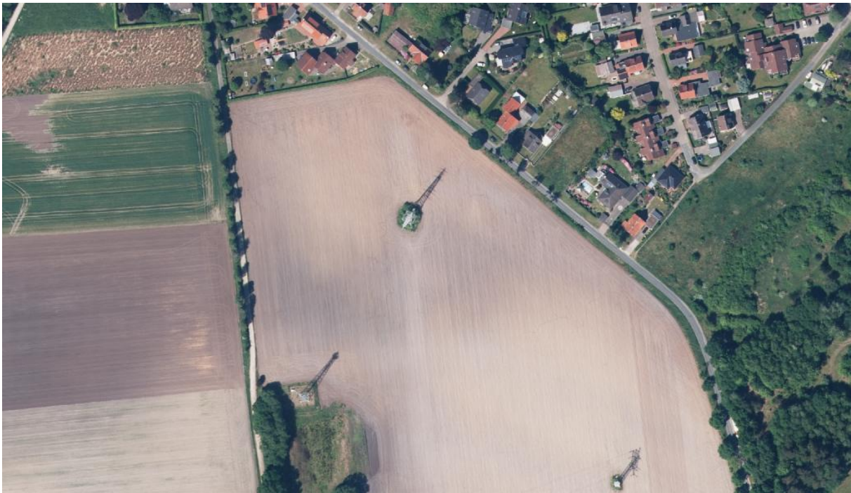
Abbildung 1. Lage des Geltungsbereiches, Niedersächsische Umweltkarten mit Daten des LGLN 2026.

Der Geltungsbereich liegt im Süden der Stadt Bremervörde und wird derzeit vollständig landwirtschaftlich genutzt. Im Westen grenzt der Geltungsbereich an den Feldweg „Am Zweitenfeld“. Südlich des Geltungsbereiches bestehen ein Mobilfunkmast und eine Grünfläche. Nördlich und östlich des Geltungsbereiches liegen landwirtschaftliche Flächen, die bereits technisch durch bestehende Freileitungsmasten vorgeprägt sind. In mind. 150 m Entfernung zum Geltungsbereich liegen nach Norden, Nordosten, Südosten und Süden Wohnnutzungen. In ca. 300 m Entfernung liegt östlich des Geltungsbereiches ein Umspannwerk.