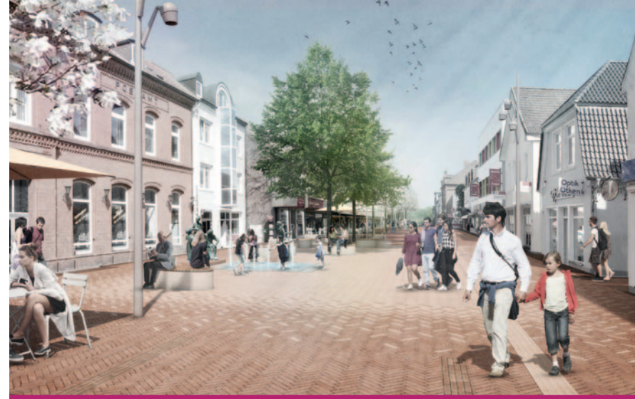
Modern, offen und barrierefrei: Die Brunnenstraße wird seit Juni nach einem Entwurf der Trüper, Gondesens und Partner mbB im Rahmen der Sanierungsmaßnahme „Innenstadt Mitte“ umgestaltet.

Für die Bauarbeiten wird die Brunnenstraße für den motorisierten Fahrzeugverkehr voll gesperrt. Eine Ausnahme wird für den Lieferverkehr gemacht, der die anliegenden Geschäfte zu vorher abgestimmten Zeiten anfahren darf. Einzig Einsatzfahrzeuge von Feuerwehr und