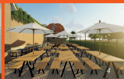
Foto 1: Das ehemalige Wohnhaus der Familie Bachmann soll saniert und in den neuen Gebäudekomplex eingebunden werden. Foto 2: Am Westerende in Bremervörde sollen ein Kino und ein Veranstaltungszentrum mit Gastronomie entstehen. Foto 3: Die Innenarchitektur des Gebäudes ist modern und offen gestaltet. Foto 4: An der Wesermünder Straße ist ein Biergarten geplant.

sowie private Feiern bieten. Angedacht ist von den Planern auch ein kleines Hotel in direkter Nachbarschaft. So würden sich die Gäste nach den Feierlichkeiten den langen Heimweg sparen.